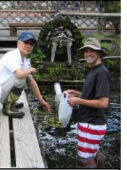
昔の豊かな自然を願い、モクズガニを放流。 全国一斉水質調査に今年度も協力し、三島市内各所で水質調査。 ミシマバイカモの定期的な手入れ。