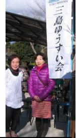
「七草粥のつどい」を塚田冷子会長宅の庭で開催し、多くの市民に喜ばれる。コールロベリアの美しい歌声が響く。豊岡武士三島市長、市長夫人も参加。