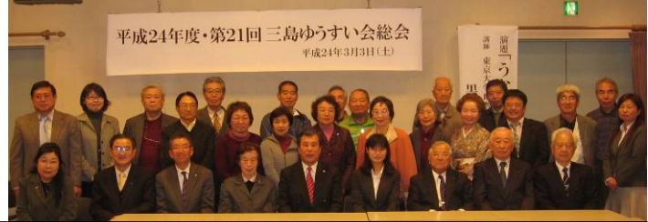
「平成 24 年度・第 24 回三島ゆうすい会総会」の記念講演会は、東京大学助教の黒木真理先生の『うなぎの博物誌』。多くの聴衆が興味深く聞き入った。