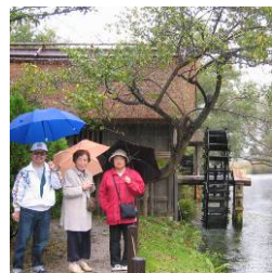
三島市内の小学校へ出前授業にも。 研修に参加した会員の報告会を開催したり、先進地へ視察研修に行ったり、自分たちも学びの機会を得ている。