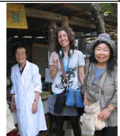
「三島ホテルまつり」に協力したり、他団体から大震災復興支援チャリティーコンサートの収益金を託されたり、海外の方々に活動を紹介したり・・・

ご一緒に活動しませんか？ 平成 3 (1991) 年に設立され、22 年目を迎えます。 平成 24 (2012) 年度の活動紹介