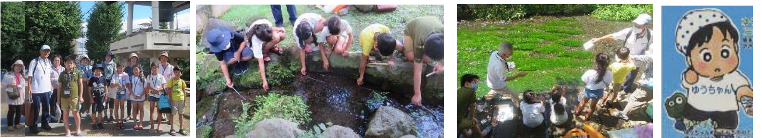
「ゆうすい探検 2021」で子供たちと水辺散策。水温を測り、CODと全硬度のパックテスト体験に子供たちは興奮。「ゆうちゃん」も登場。