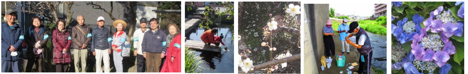
2月にも水質調査。季節が異なると水辺の風物にも新発見がある。6月に第18回「身近な水環境の全国一斉水質調査」を例年どおり実施。