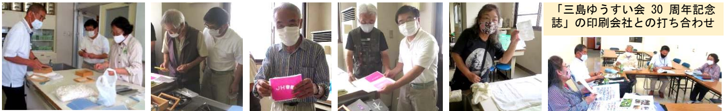
「三島ゆうすい会 30周年記念誌」の印刷会社との打ち合わせ