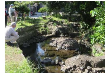
三嶋大社参拝者の清めの水だったという鏡池は、年によっては湧く。