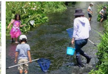
御殿川で水遊びを楽しむ親子。生き物観察に夢中な子供も多い。