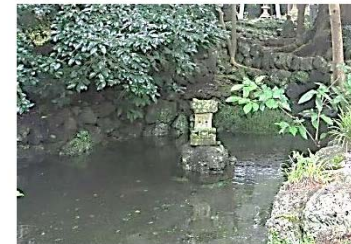
富士登山の前に参拝したという浅間神社横の池は、湧く年もある。