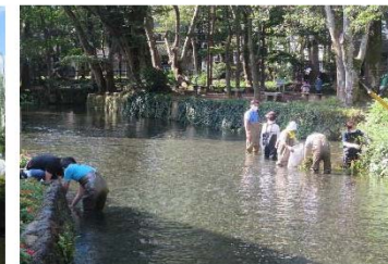
孤池と白滝公園の湧き水が流れる桜川も市民が定期的清掃。