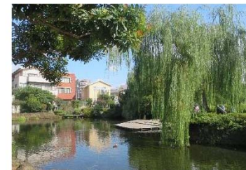
昔は大きな丸い池だった孤池は、現在ではポンプアップしている。