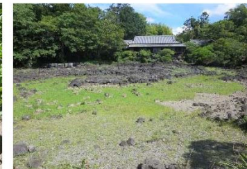
湧水期の小浜池は、約1万年前の富士山からの溶岩が現れる。