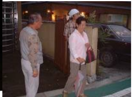
△源兵衛川への案内も親切に