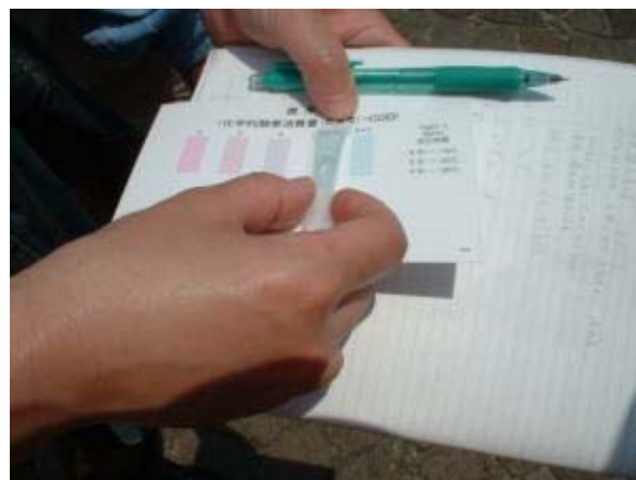
△慎重にCODの結果を調べます

今回の一斉調査には、全国でおよそ1,000団体(個人も含む)が参加しました。河川を中心とした、それぞれの身近な水域(河川数:約180)、調査地点:約5,800カ所で、市民団体や学校の協力により調査が行われました。