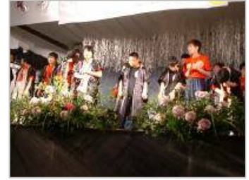
△ほのぼのしたトークと歌

メイン会場のステージでは、ゲストの歌の数々が披露され、観客も手拍子をとったり口ずさんだりしながら楽しんでいました。また、途中蛍が放されると、子ども