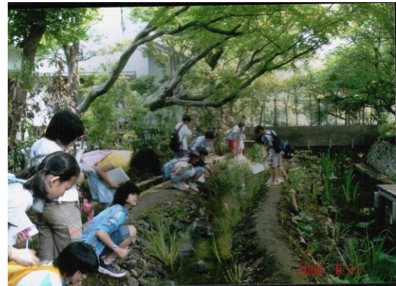
△ホタル以外に、カワニナやザリガニなども真剣に観察

ホタルの成育の説明、飼育施設の見学のあと、「ほたるの里」に行き、カワニナやザリガニを手にとったり、また、たまたまホタルの雌雄が見つかり、感激最高潮で帰って行きました。この学習の成果は、ガイドブックにまとめるとお手紙をいただきました。