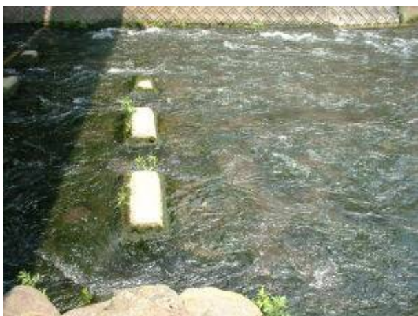
澄んでいる水の大場川の中流

今年も参加した「身近な水環境の全国一斉調査」。昨年と比べ水質調査の結果に違いが見られるかどうかと気にしながら、三島市内の川を2グループに分けて午前9時30分から水質調査を行いました。