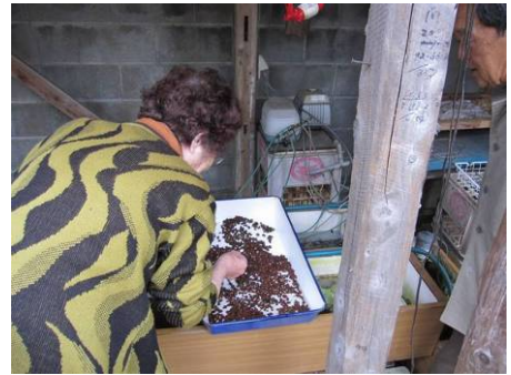
ホタルの幼虫はまだ小さくて…

会長宅の庭には、水琴窟、天水尊、水車と水にかんする設備が多くあり、「水の博物館ですね」と感心して帰られました。