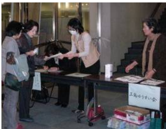
人り口でアンケート用紙も配って

を元気にしようという活動をしています。何時の日かハリウッド映画に、この美しい街三島を紹介したいと思っています。